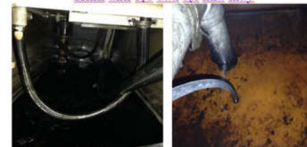
Bể dầu trước khi lọc