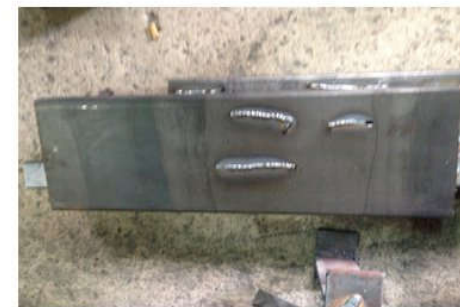
Khi sử dụng dầu chống dính xỉ hàn TD Oil Welding. Bề mặt xung quanh mối hàn không còn bị dính xỉ