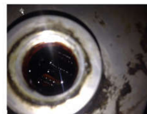
Hình ảnh trong két làm mát trước khi súc rửa Keo dầu bám dày bên trong những lá nhôm mỏng