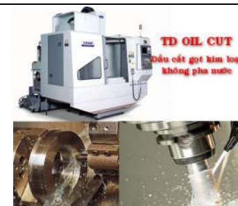
TD OIL CUT Dầu cắt gọt kim loại không pha nước

TD Oil Cut là sản phẩm dầu cắt gọt kim loại không pha nước chất lượng cao không mùi an toàn với người sử dụng