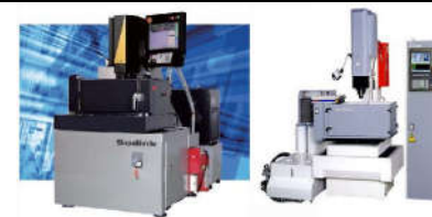
TD OIL EDM - Dầu gia công tia lửa điện

Sản phẩm chất lượng cao, không mùi khó chịu, IP< 3% Không gây ung thư. Nguyên liệu được nhập khẩu đạt tiêu chuẩn Europ ( Châu Âu )và ASTM ( Mỹ )