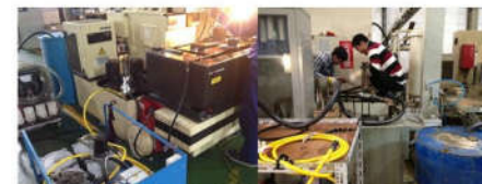
Hình ảnh lọc dầu tại nhà máy