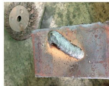
Khi không sử dụng dầu chống dính xỉ hàn. Bề mặt xung quanh mối hàn rất nhiều xỉ