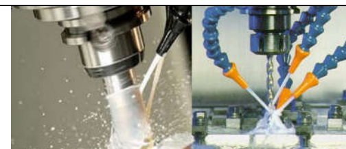
TD CUT EP - Dầu cắt gọt kim loại

Là sản phẩm dầu cắt gọt kim loại pha nước chất lượng cao thế hệ mới không độc , không mùi khó chịu, an toàn cho người sử dụng và môi trường.