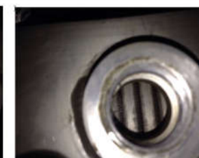
Hình ảnh bên trong két làm mát sau khi súc rửa Két được làm sạch nhìn rõ những lá nhôm mỏng