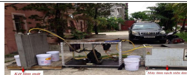
Két làm mát

+ Khi giàn làm mát bị tắc. Dịch vụ vệ sinh giàn làm mát : Giúp tẩy rửa cặn, keo dầu không phải phá dỡ, không gia nhiệt, không làm mất lớp oxit nhôm trên bề mặt dàn làm mát dầu.